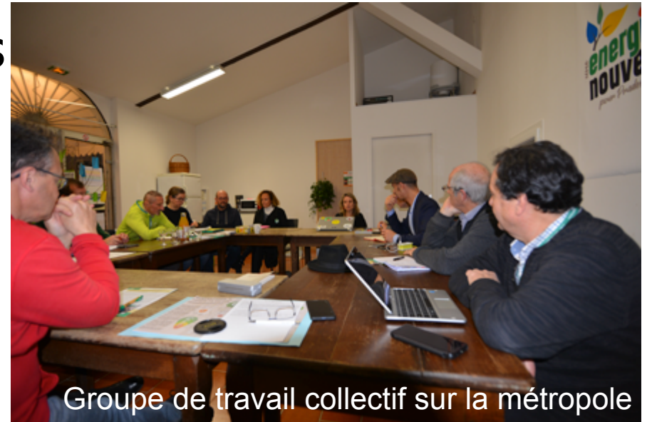
Groupe de travail collectif sur la métropole