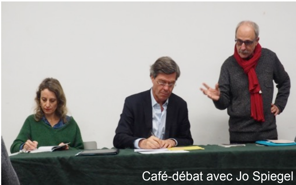
Café-débat avec Jo Spiegel

Travailler avec les citoyens et non pour les citoyens